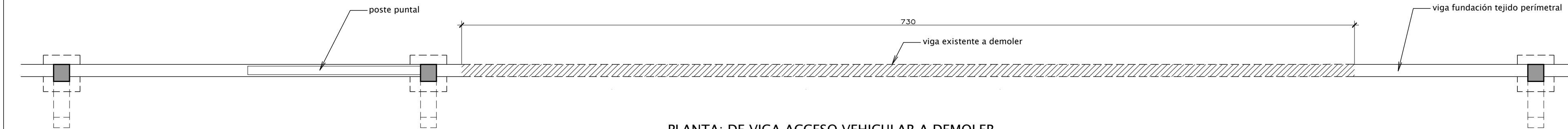
PLANTA: DE VIGA ACCESO VEHICULAR A DEMOLER ESC.:1/25