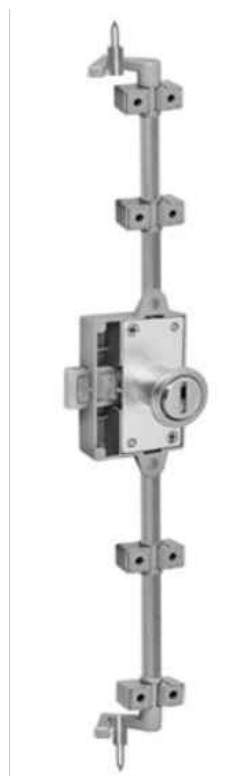
DETALLE CERRADURA FALLEBA