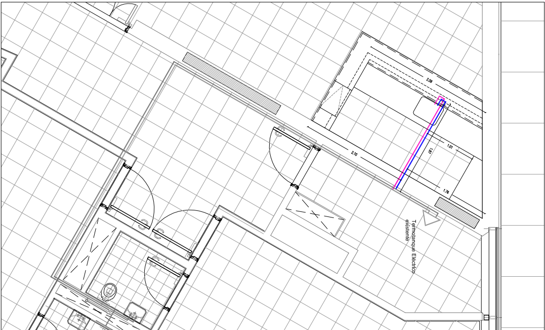
Red de Distribución de Agua Fría y Caliente - General