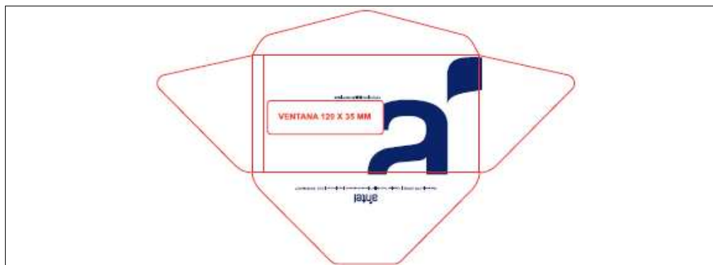
Figura 1 – Ejemplo de diseño (Cara exterior). Las anotaciones y los bordes en rojo son referencias y no se imprimen en el sobre.

A continuación se adjunta muestra de diseño para tomar como referencia. El diseño definitivo podrá diferir del adjunto.