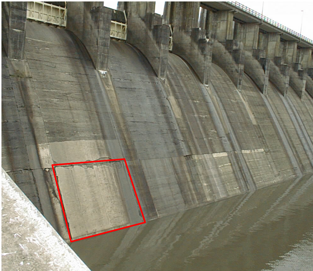
Figura 1. Sector con superficie sobresaliente al plano de la solera.