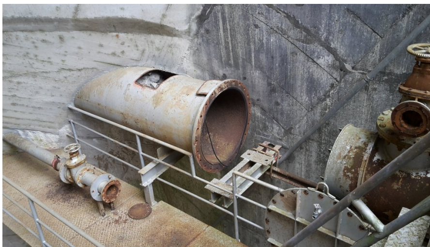
Figura 3. Caño 900mm a sellar.

Se muestra a continuación el estado actual del caño.