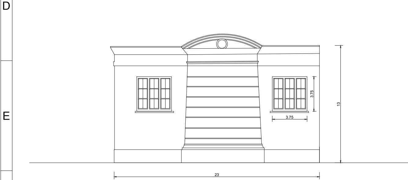
FACHADA CALLE JUJUY