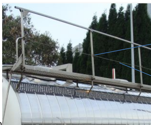
Imagen de ejemplo:

El sistema de plegado debe tener al menos 2 amortiguadores a gas para facilitar la manipulación y debe ser en la dirección del plano que forma la baranda.