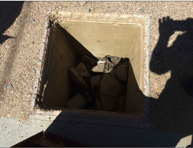
IMG1. CAMARA OBSTRUIDA, SIN TAPA.