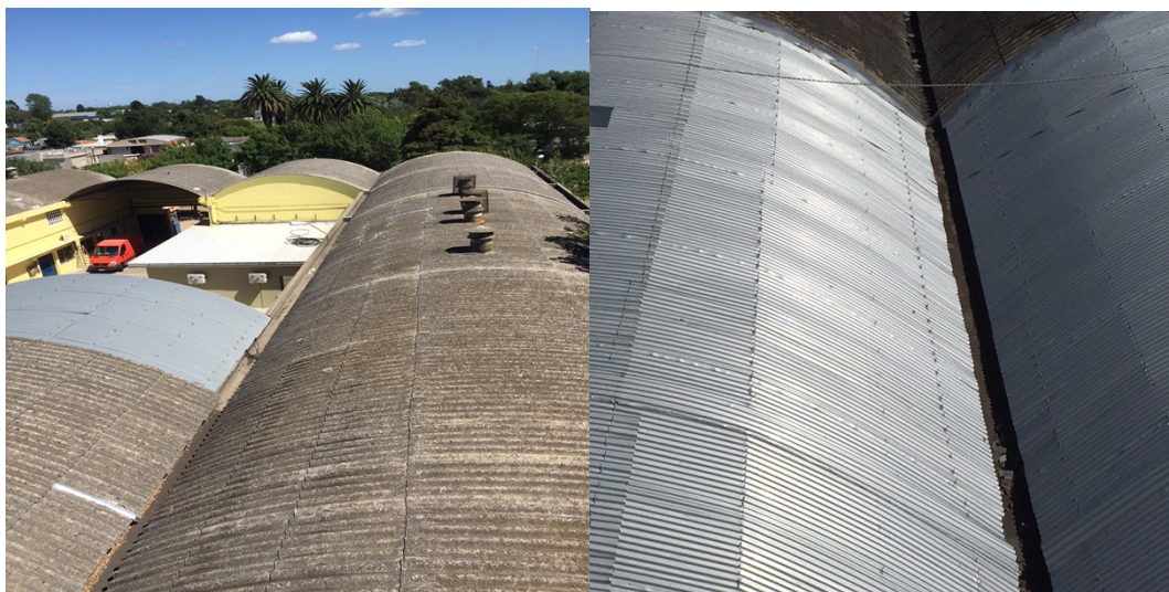
Fig. 1-2 – Canalones

Todos los canalones de desagüe de los techos deberán ser limpiados. Dicha tarea será cotizada en éste rubro. (figura 1 y 2)