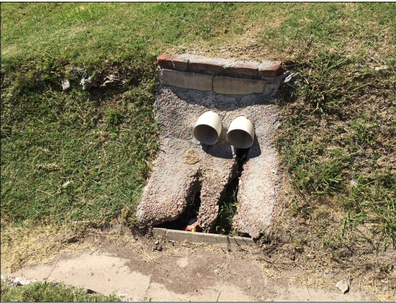
IMG2. CABEZAL EN MAL ESTADO