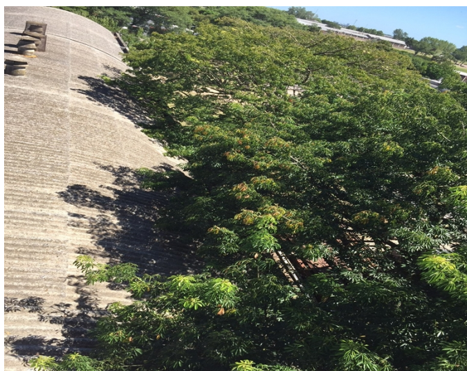
Fig. 3– Árboles a podar

Se podarán los árboles que se muestran en la figura 3. Las ramas y hojas serán retiradas del predio. Las tareas de poda y retiro serán cotizadas en éste rubro.