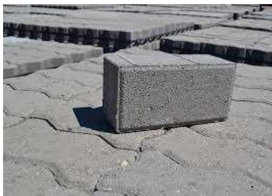
adoquín de granito imágenes a modo de sugerencia

Se solicita reparar sector de vereda de hormigón en ingreso al garaje de la Sede.