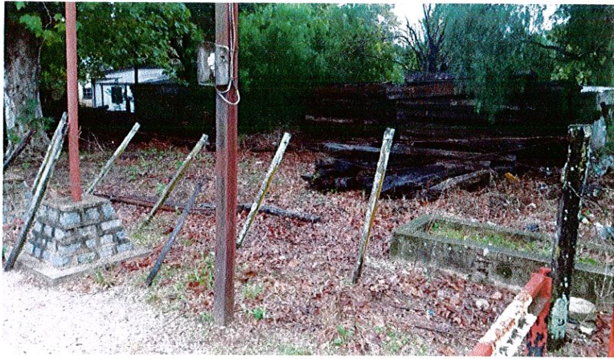
ACOPIO EN BAÑADOS DE ROCHA (km 464)