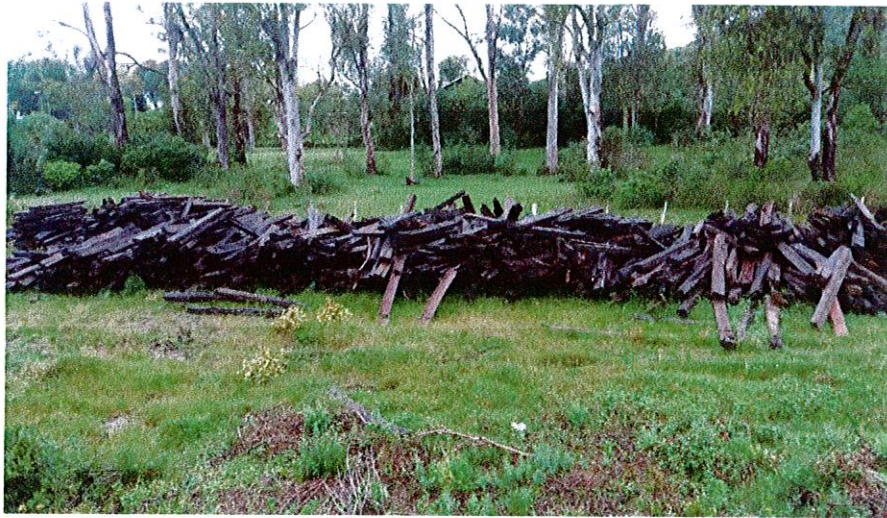
ACOPIO EN TACUAREMBÓ (km 445)