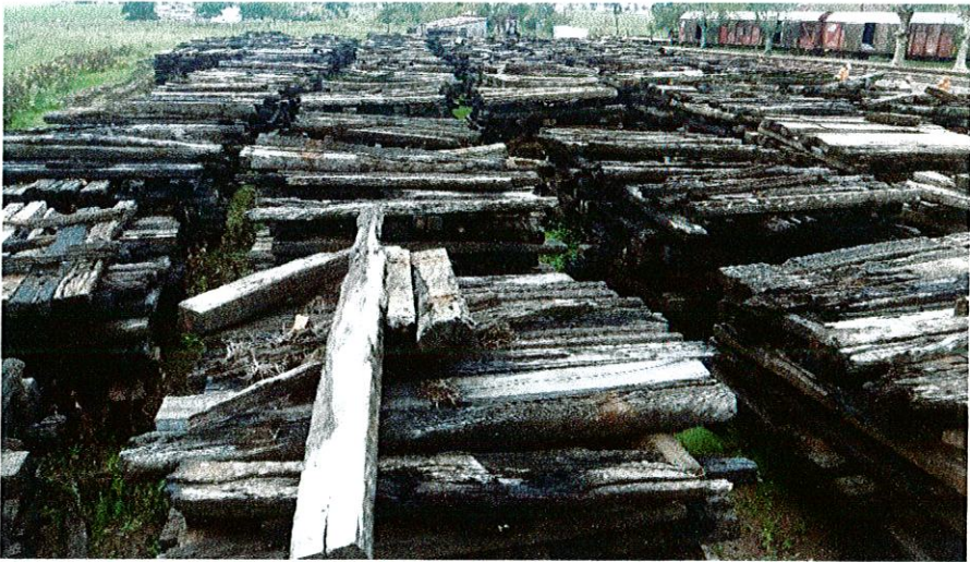
ACOPIO EN TAMBORES (Km 407)