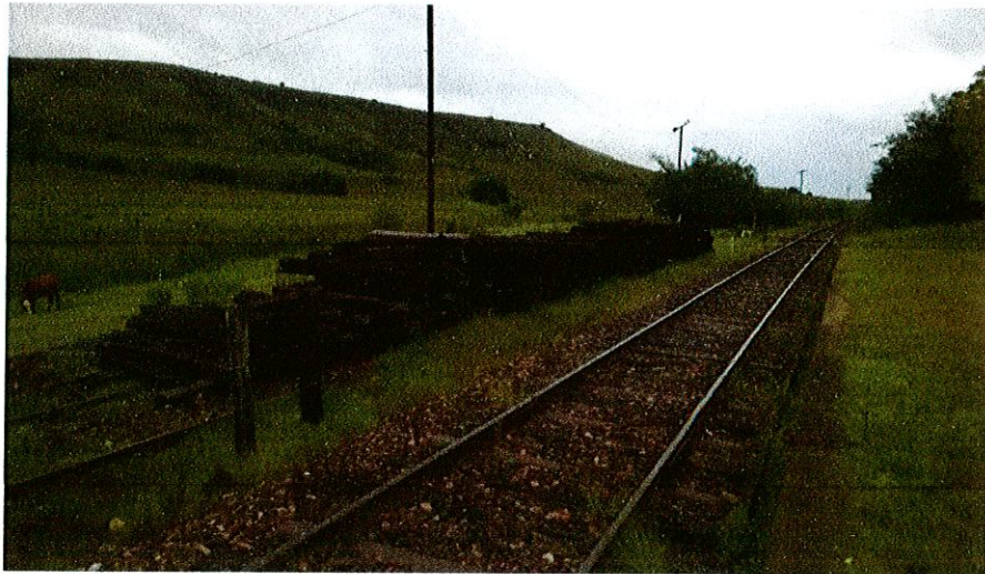
ACOPIO EN PASO DEL CERRO (km 479)