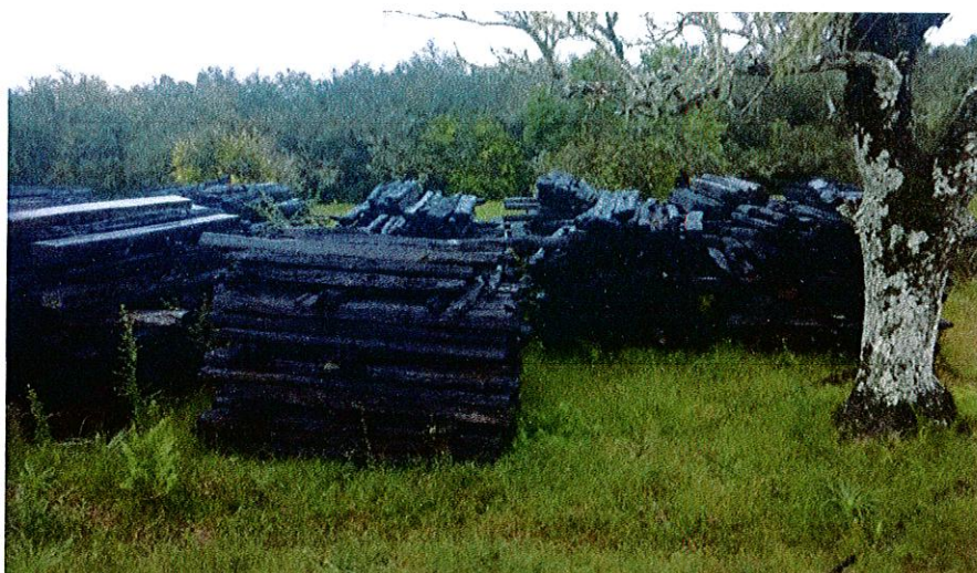
ACOPIO EN RIVERA (km 563)