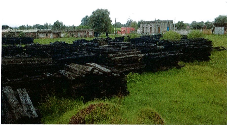
ACOPIO EN PASO ATAQUES (km 534)