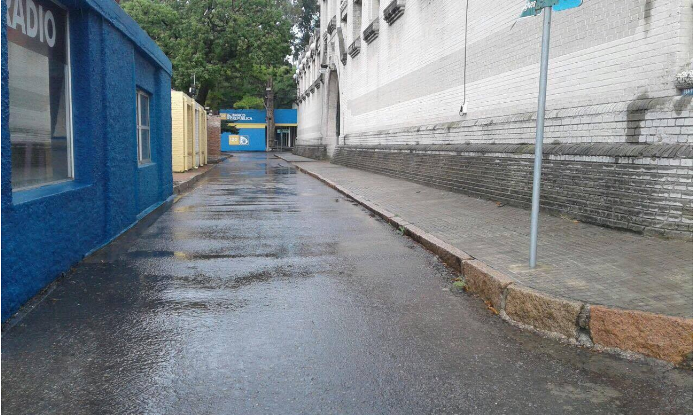
Acera lateral del Galpón 2, sobre la calle Ricardo Hughes.