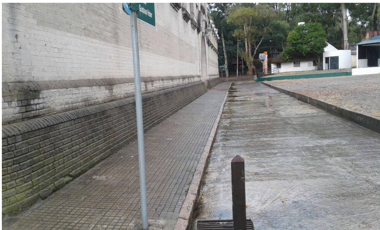
Acera lateral del Galpón 2, sobre la calle Gustavo Heber.