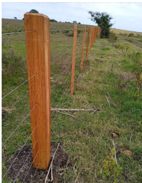
Figura 1. Foto ilustrativa de un alambrado perimetral.

Una vez enterrados los postes, deberán quedar a la misma altura que los piques, a 1,4 m de altura. Si el suelo no permite enterrar el poste a la profundidad deseada, se deberá colocar una cruceta. En el caso de tener que colocar 2 o más crucetas seguidas, éstas deberán quedar ancladas al terreno, mediante postes cuadrados de eucalyptus o 2 piques de mayor cuerpo.