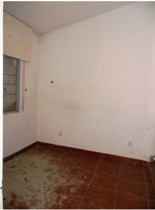
ID. 111705 - 20180801 - foto 9. Dormitorio al fondo