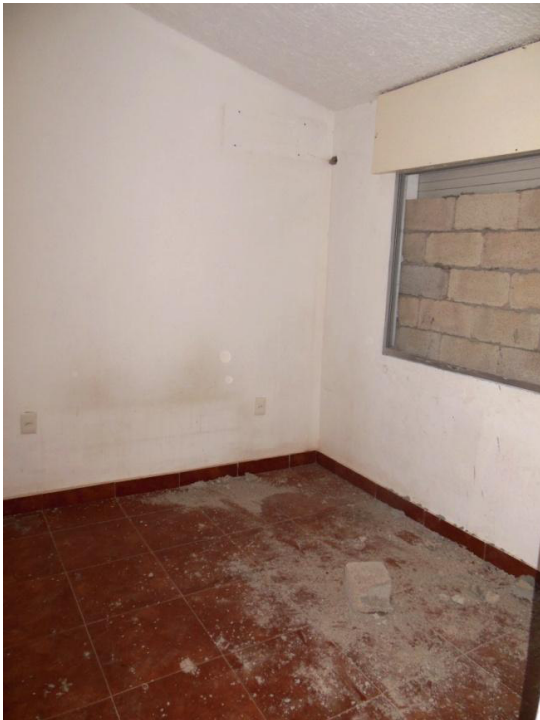
ID. 111705 - 20180801 - foto 7. Dormitorio al frente