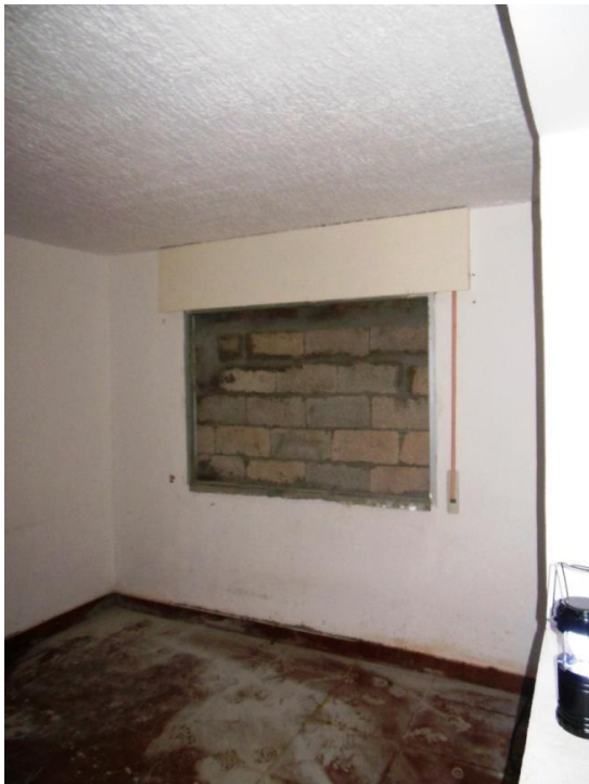
ID. 111705 - 20180801 - foto 3. Estar-Comedor