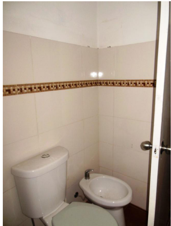
ID. 111705 - 20180801 - foto 12. Baño