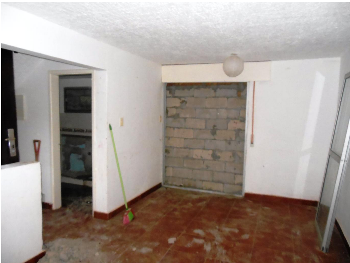
ID. 111705 - 20180801 - foto 5. Estar-Comedor