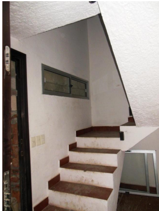
ID. 111705 - 20180801 - foto 4. Acceso vivienda-Escalera