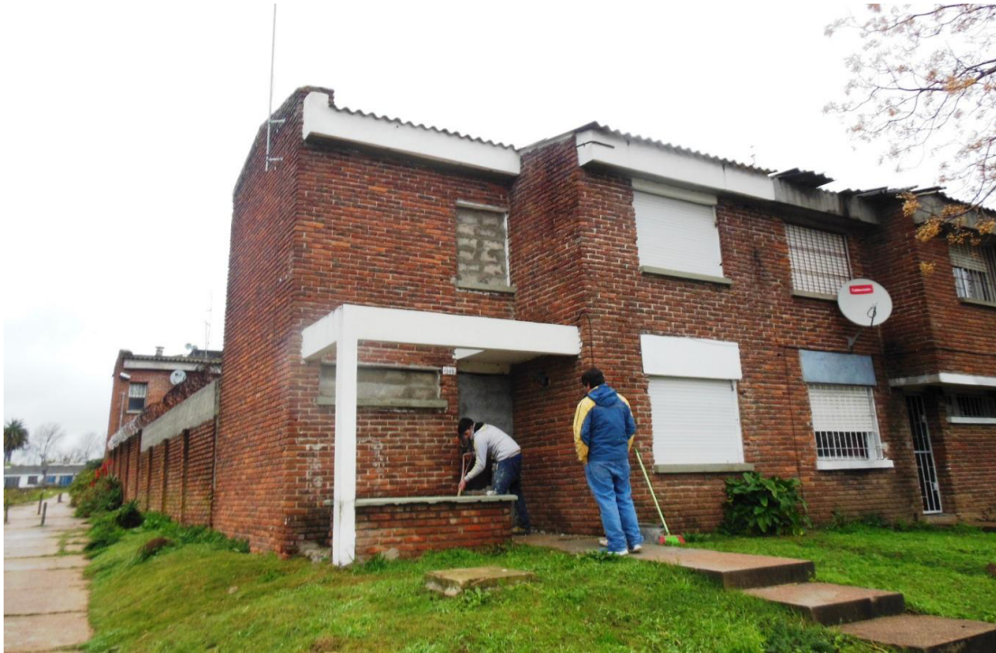
ID. 111705 - 20180801 - foto 1. fachada - acceso.