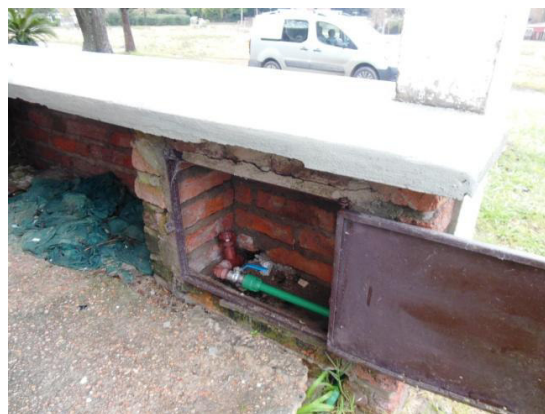
ID. 111705 - 20180801 - foto 14