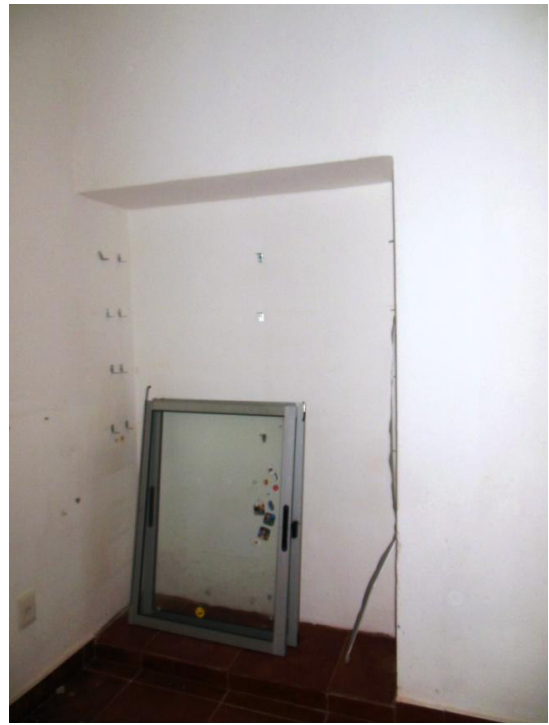
ID. 111705 - 20180801 - foto 10. Dormitorio al fondo