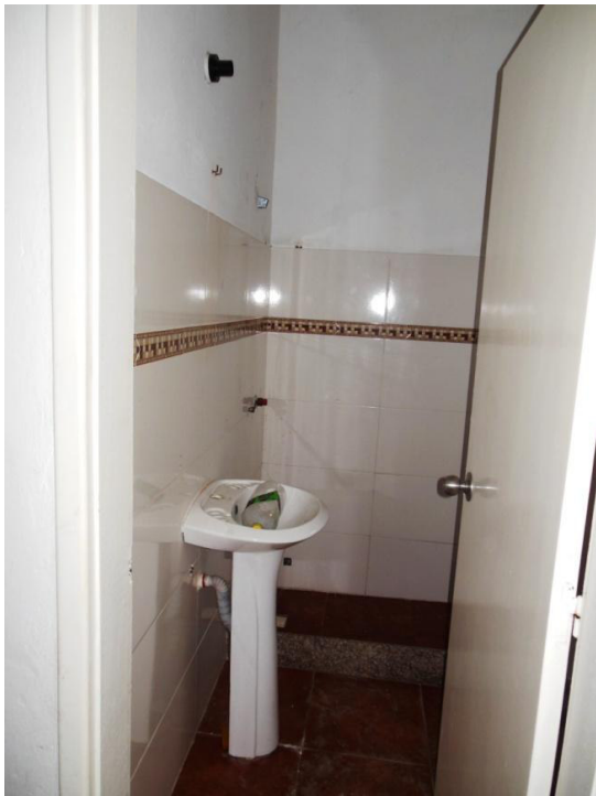
ID. 111705 - 20180801 - foto 11. Baño