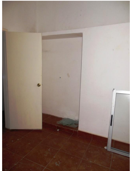
ID. 111705 - 20180801 - foto 8. Dormitorio al frente