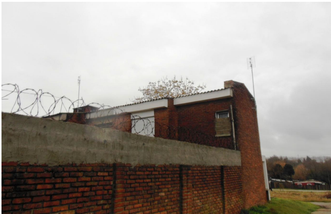
ID. 111705 - 20180801 - foto 2. fachada posterior.