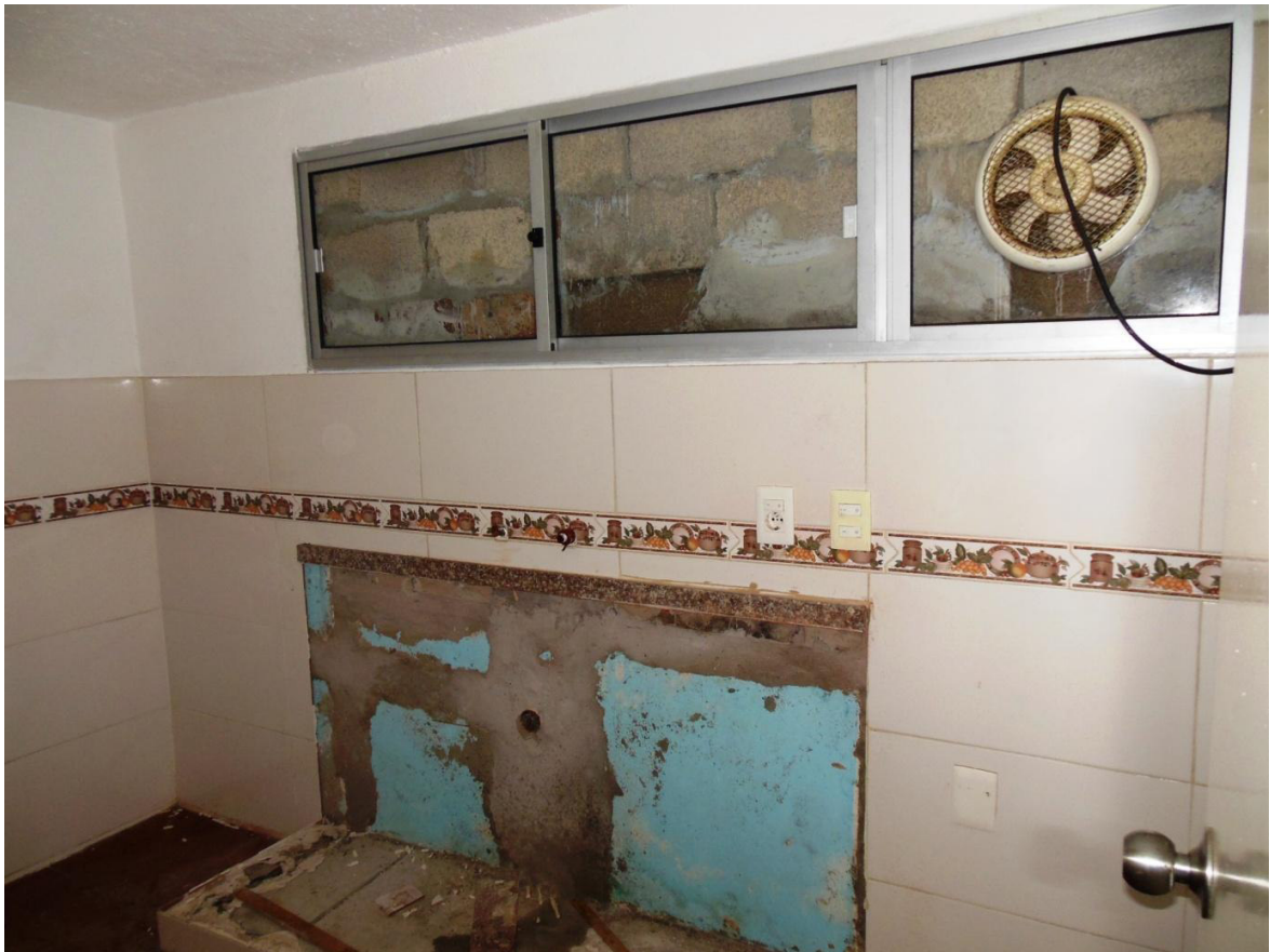
ID. 111705 - 20180801 - foto 6. Cocina