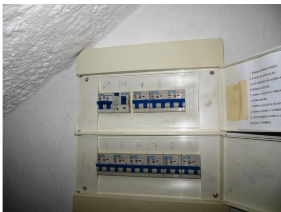
ID. 111705 - 20180801 - foto 13.