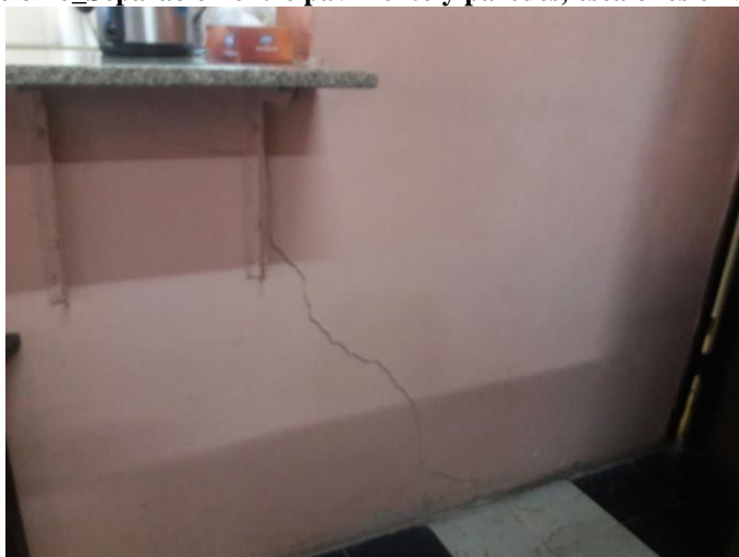
Ilustración 9_Fisura nueva entre comedor y cocina, debajo de pasa-platos