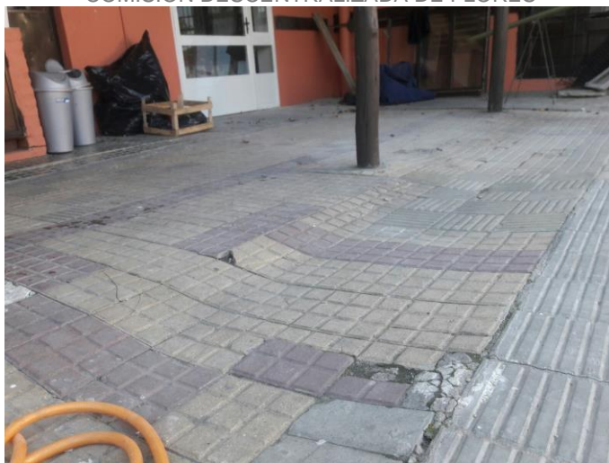
Ilustración 4_ Otra vista de hundimiento de pavimento en patio