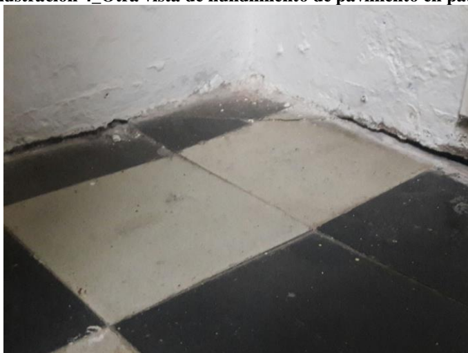
Ilustración 5-Pavimento separado de la pared en aula