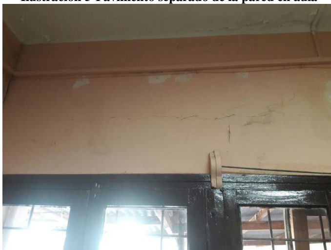
Ilustración 6_Fisura en pared de Aula