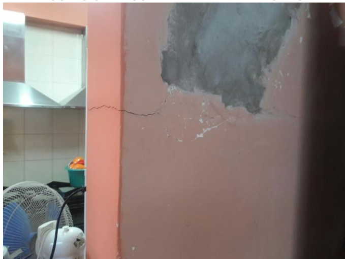
Ilustración 10_ Fisura nueva en pasa-platos entre cocina y comedor