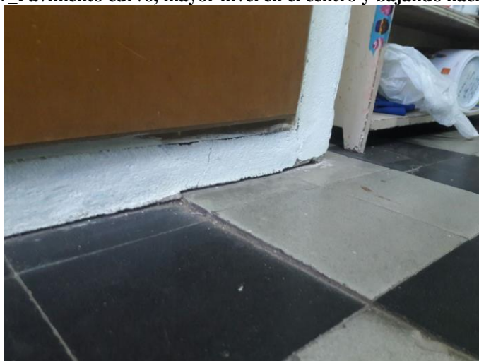
Ilustración 8_Separacion entre pavimento y paredes, escalones en baldosas