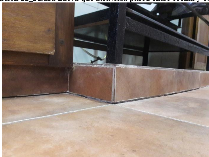
Ilustración 12_Separacion reciente entre pavimento y zócalo en cocina