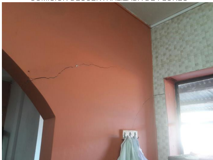
Ilustración 13_Fisuras recientes en paredes de cocina