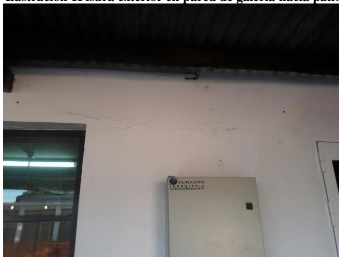
Ilustración 2 Fisura en aula, pared que da a galería