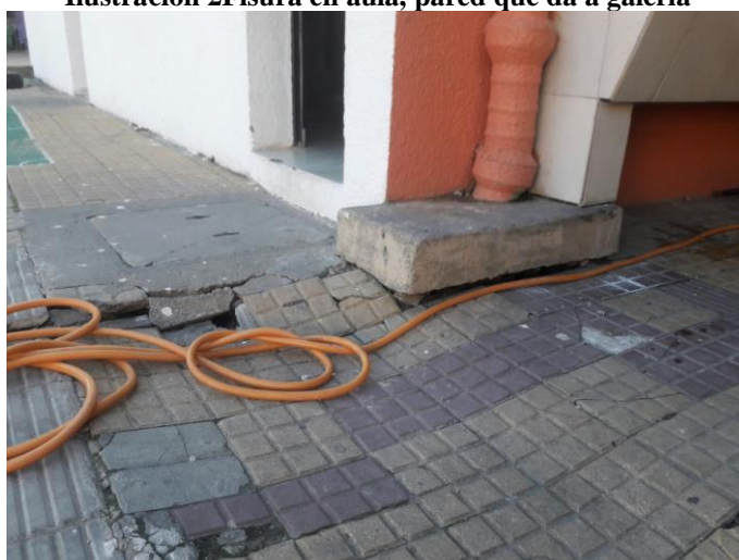
Ilustración 3 -Pavimento hundido en patio