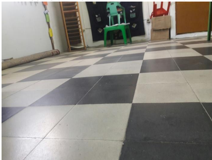
Ilustración 7_Pavimento curvo, mayor nivel en el centro y bajando hacia las paredes