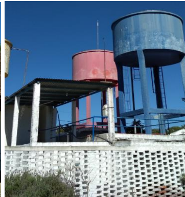
Tanques de agua