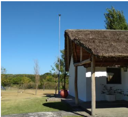
Parador Zona Nidos “1”