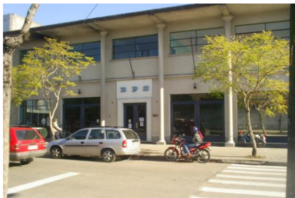
Calle Gilomen esquina Éxodo