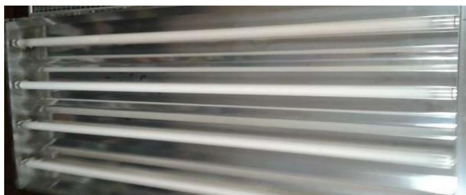
Vistas luminaria "tipo"