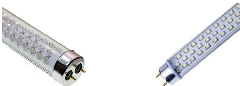
Lámparas tubulares "tipo"