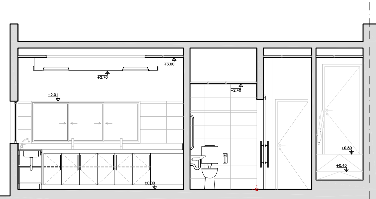
CORTE CC esc. 1:50