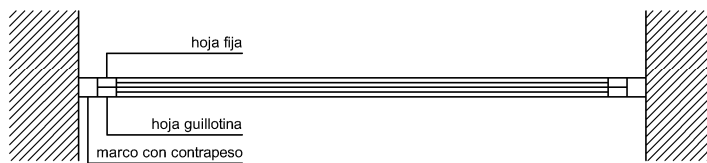
PLANTA esc 1.20

NOTA: TODAS LAS MEDIDAS SE RECTIFICARÁN EN OBRA