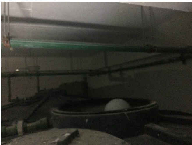
Foto 5 . Espacio en subsuelo donde se alojan los tanques de agua del edificio. Suspendido de la losa se instalará el ducto de desagüe de AACC de planta baja.