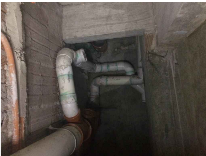
Foto 4 . Sistema de desagüe actual del edificio donde se conectará mediante sifón el desagüe de los equipos de AACC de planta baja.