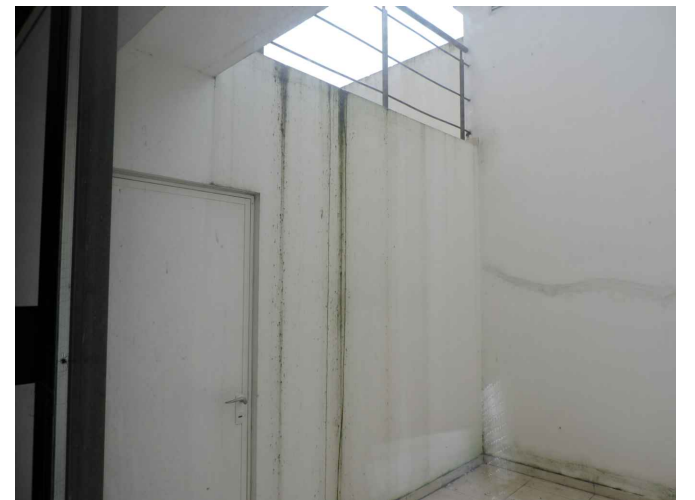
Foto 6 . Terraza en primer nivel donde se dispondrán las condensadoras de los equipos de AACC.

Nota: Gráficos a modo de anteproyecto las medidas y distancias deberán ser confirmadas y rectificadas por el oferente in situ.