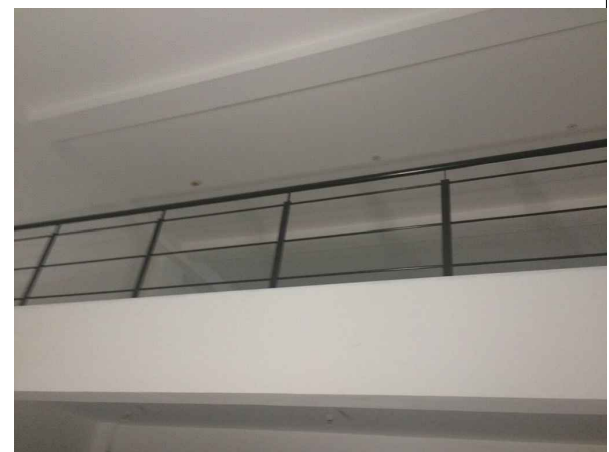
Foto 4. Baranda existente a retirar y suplantará por cerramiento A3 en aluminio y vidrio fijo arenado.