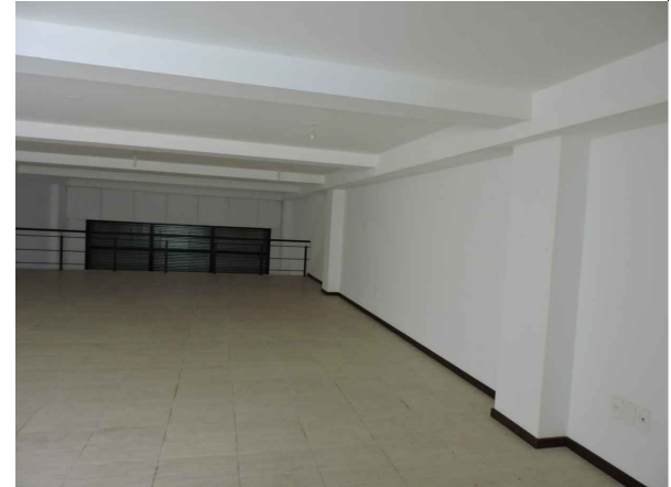
Foto 3. Local en planta alta donde se retirará la baranda existente y se dispondrá cerramiento A3 de aluminio y vidrio arenado.