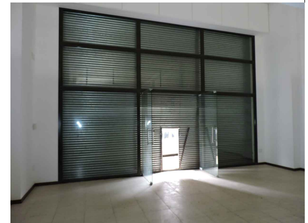
Foto 3. Cerramiento vidriado de fachada a disponer vinilos espejados.

Nota: Gráficos a modo de anteproyecto las medidas y distancias deberán ser confirmadas y rectificadas por el oferente in situ.