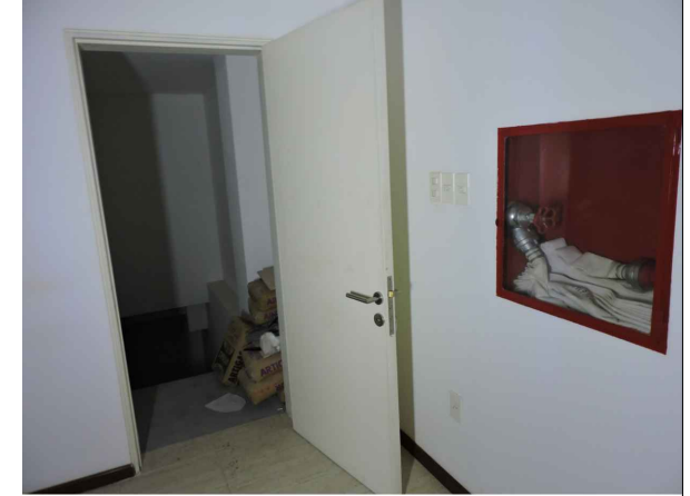
Foto 2. Espacio previsto para disponer nueva abertura. Nótese la necesidad de desplazar los tendidos eléctricos, de abastecimiento de agua potable parte del sistema de extinción de incendio.