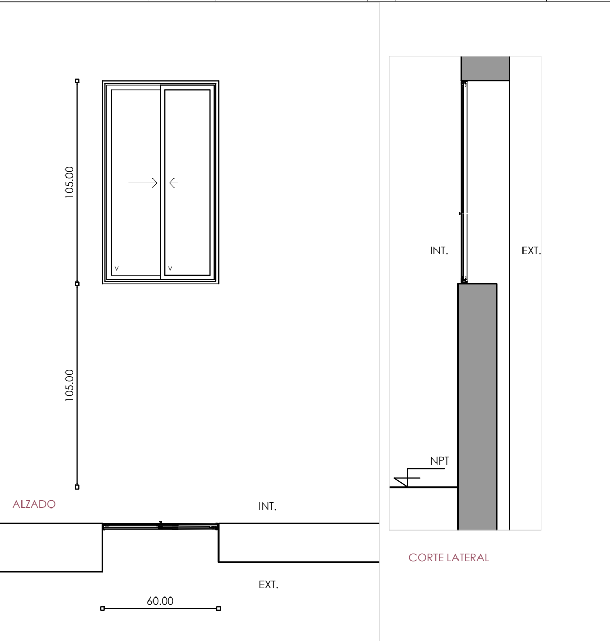
ALZADO PLANTA ESC. 1:20 Las aberturas estan dibujadas vistas desde el exterior NOTA: VERIFICAR MEDIDAS Y CANTIDADES EN OBRA