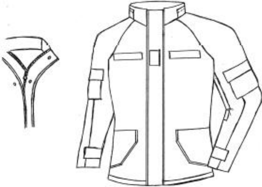
Figura 1- Vista delantero