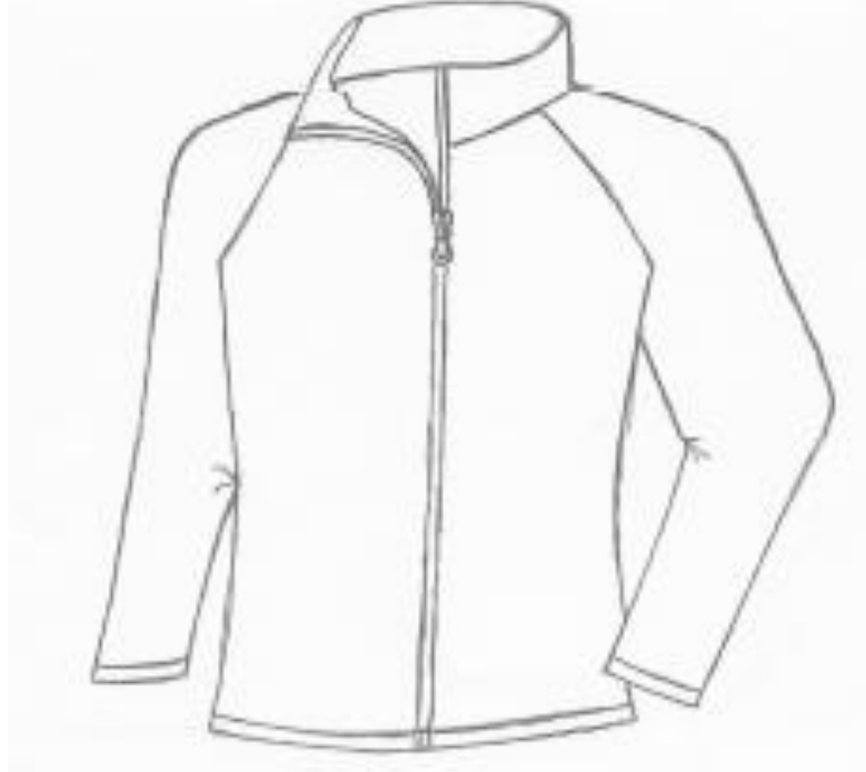
Figura 1- Vista delantero