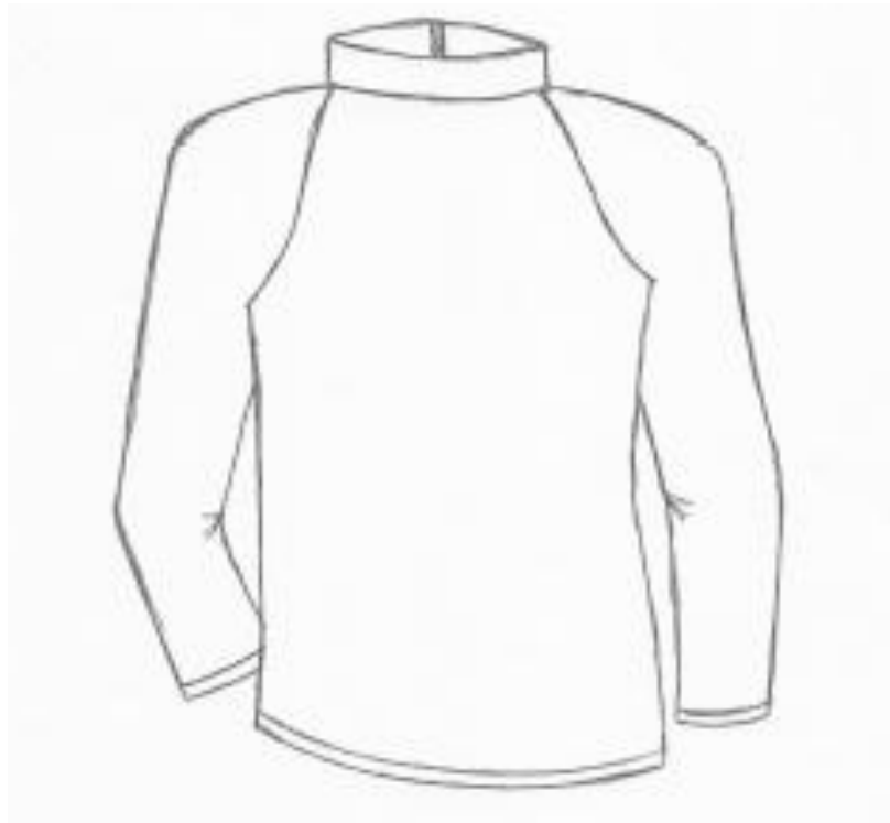
Figura 2- Vista espalda