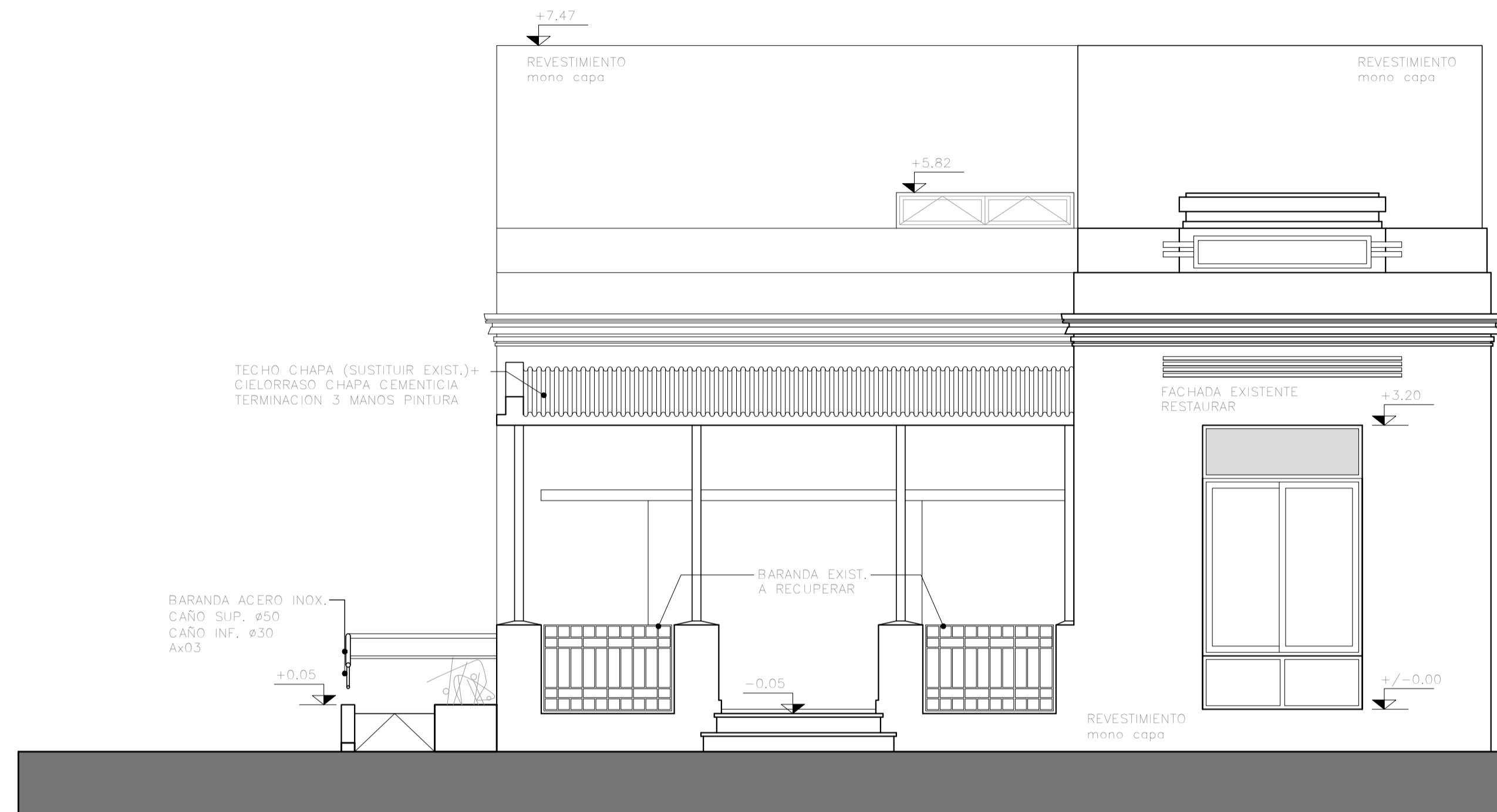
FACHADA NORTE Esc.: 1/50