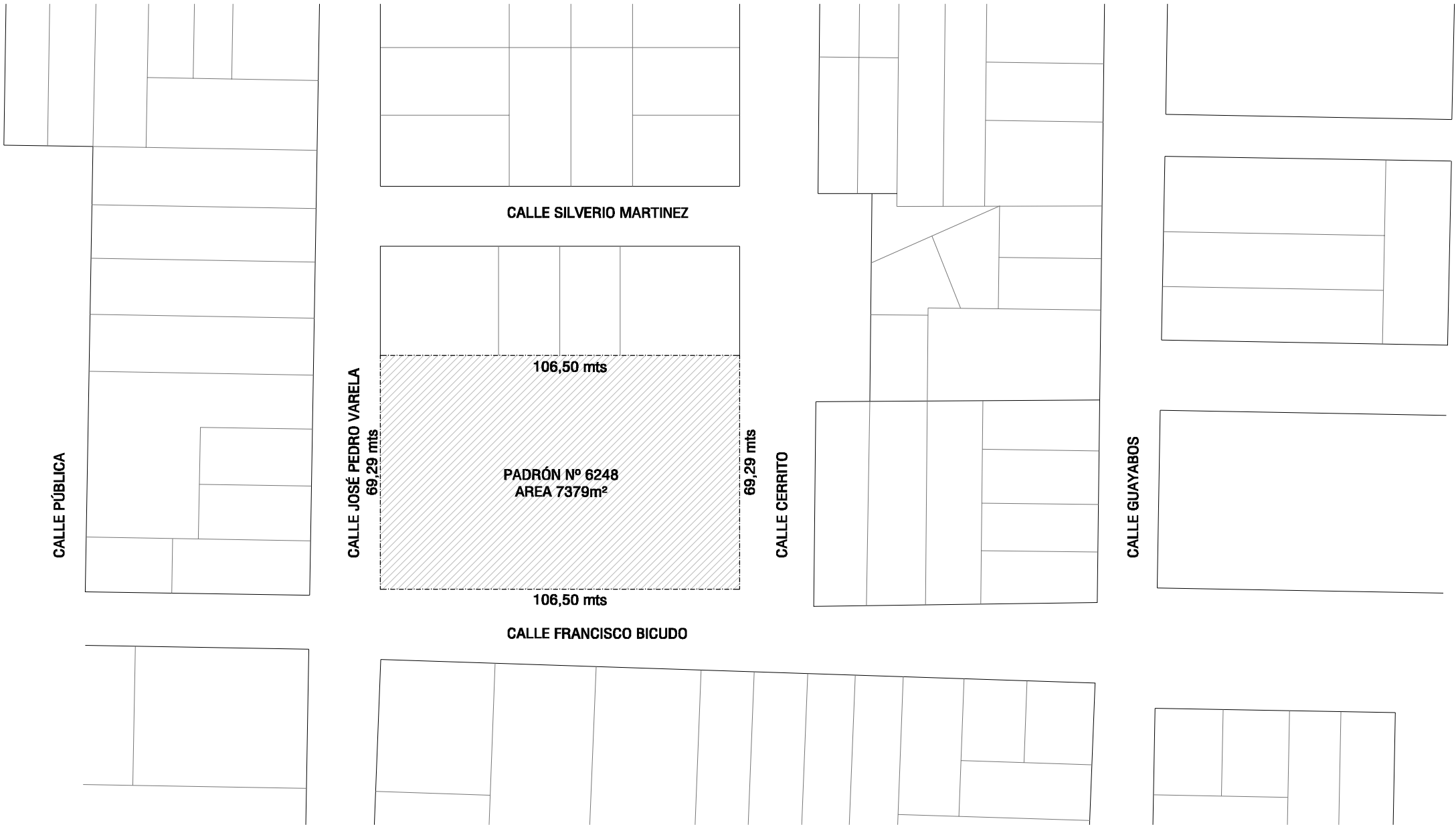
UBICACION DEL PREDIO Esc 1/1500