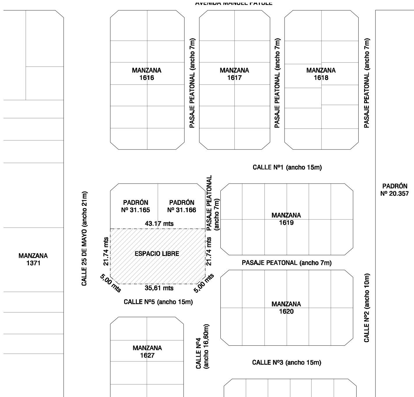
UBICACION DEL PREDIO Esc 1/1000