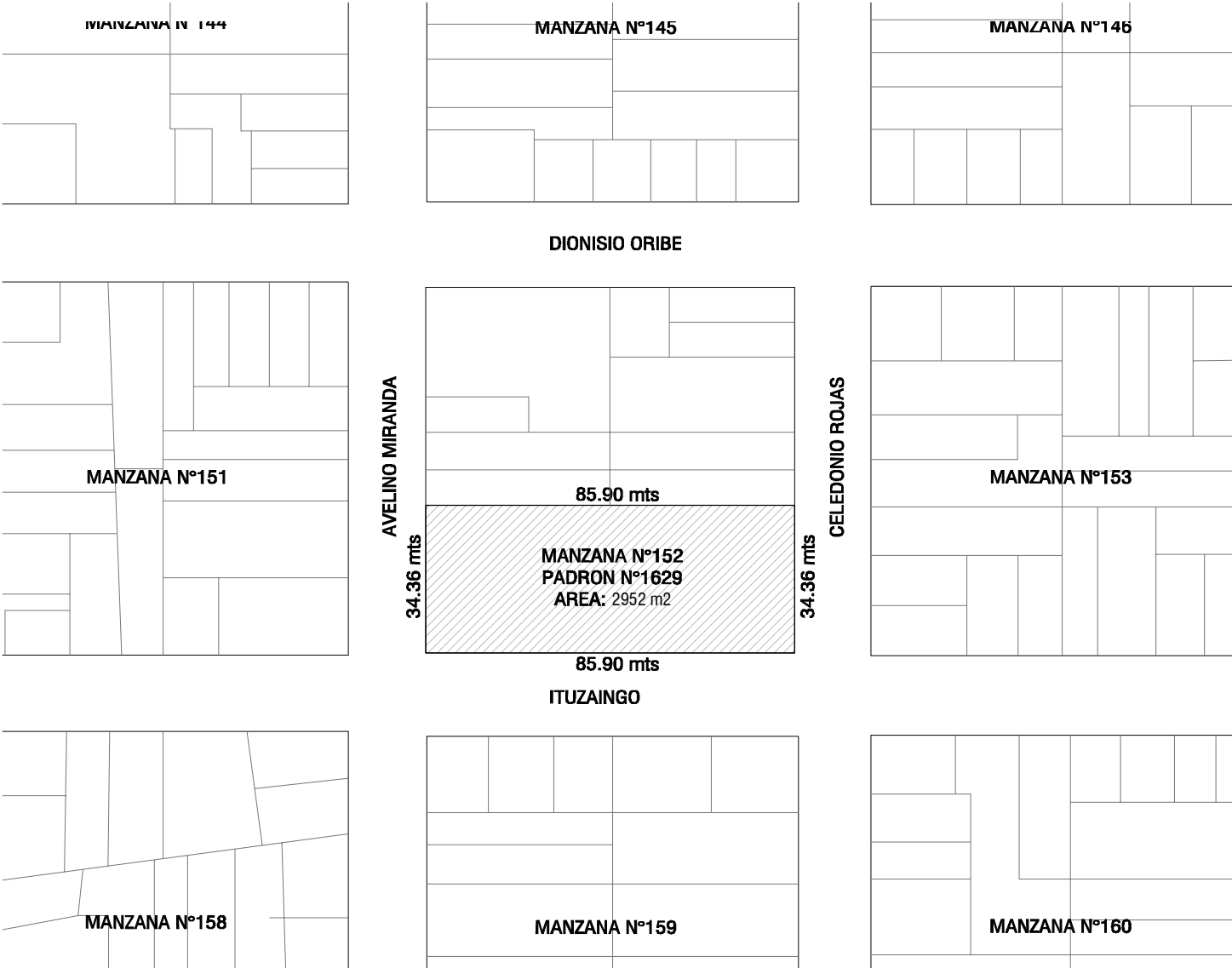
UBICACION DEL PREDIO Esc 1/1500