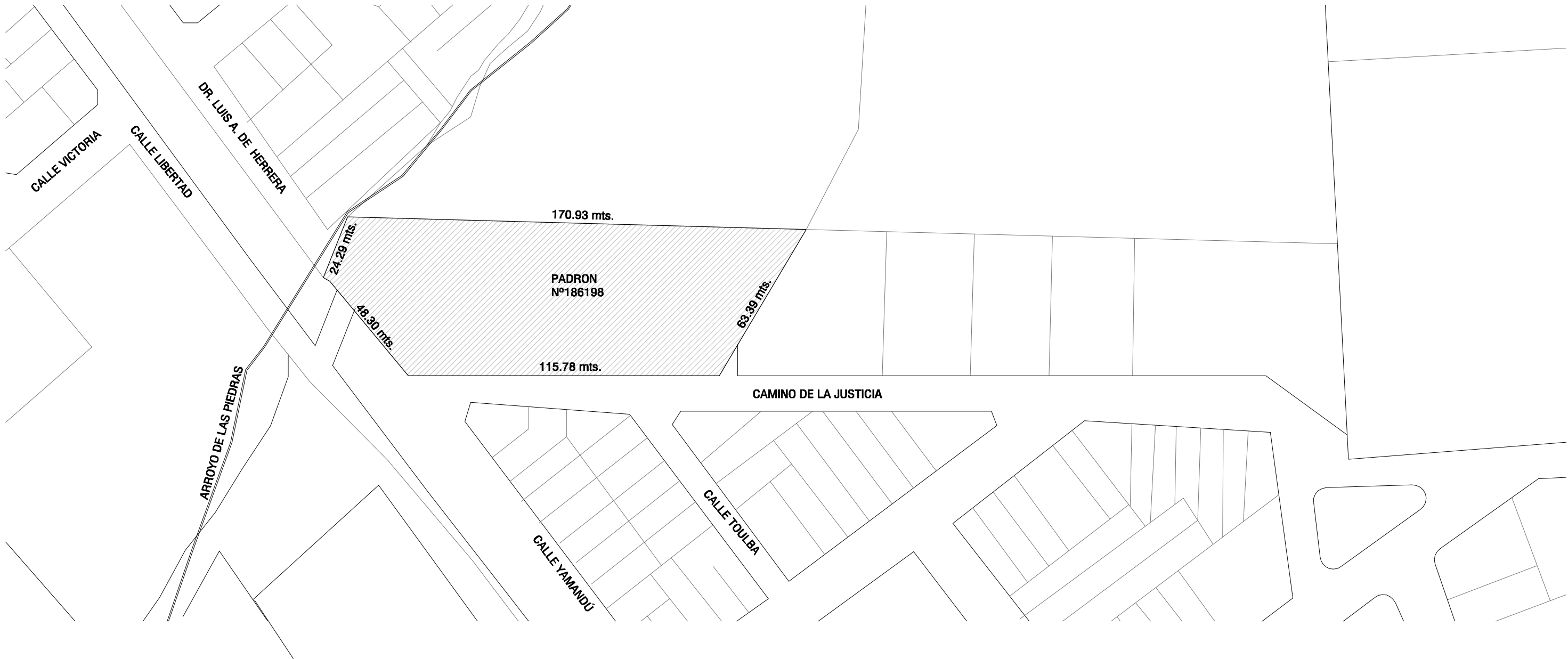
UBICACION DEL PREDIO Esc 1/1500