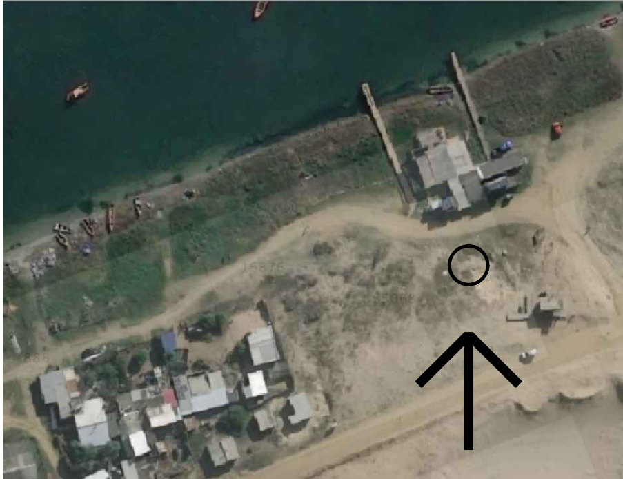
UBICACIÓN VISTA SATELITAL